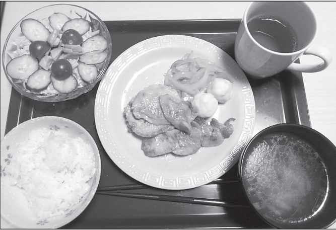
今夜のおしながき♡ ●ご飯 ●豚の生姜焼き ●マッシュポテト ●玉ねぎのソテー ●生野菜のサラダ ●キノコのスープ