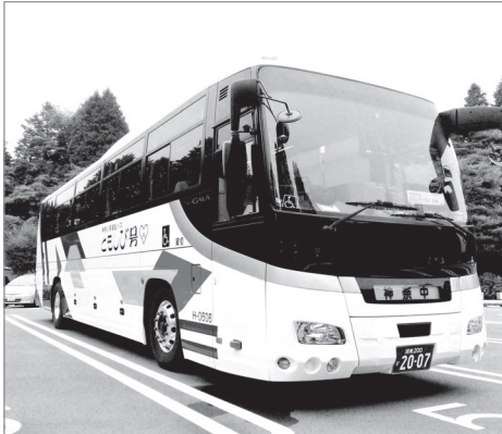
「大きいね〜」「かっこいいね〜」と乗り込んだときから皆大興奮でした。