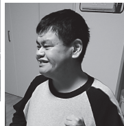
Relax Time Niji no palette